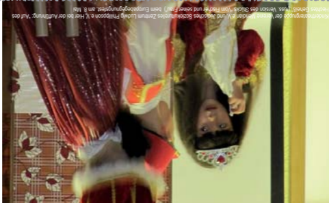
Kinderbeiträge der Mädchen (links) und Jungen (rechts) beim Euphoriefest am 8. Mai (Foto: Veronik des Stücks 'Vom Fiedler und seiner Frau') beim Euphoriefest am 8. Mai