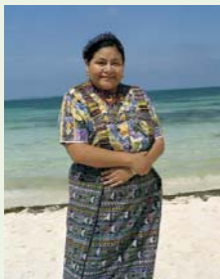
Rigoberta Menchú, Menschenrechtsaktivistin aus Guatemala, "Die andere Globalisierung" bis 18.7. wochentags 9-18 Uhr, Anmeldung: 0391-5371-200 (Infobüro einewelt haus)