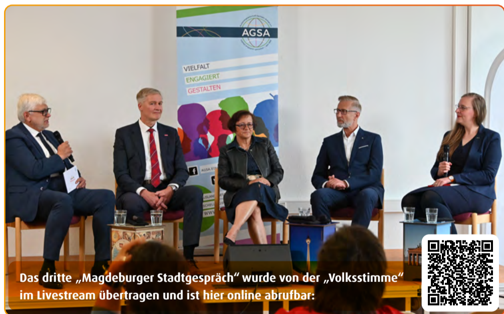
Das dritte „Magdeburger Stadtgespräch“ wurde von der „Volksstimme“ im Livestream übertragen und ist hier online abrufbar:

Das „Magdeburger Stadtgespräch“ ist hier online abrufbar.